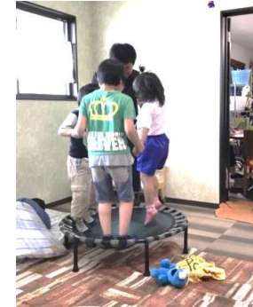
ひとりで遊ぶもよし、みんなで遊ぶもよし。