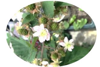
↑ブラックベリーの花。 ↓ブドウも実を結びはじめました。