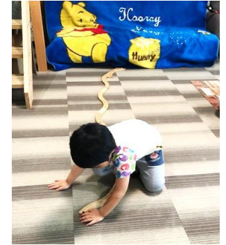
線路は続くよ、どこまでも。