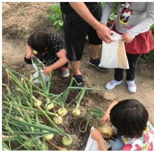
玉ねぎ、えんどう豆の収穫。農作物の体験も、この季節の恒例になりました。