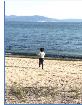
砂浜を全力疾走。岩間にはハマヒルガオが咲いています。