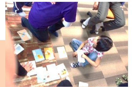
集中して取り組めることって、大切。