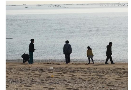
真ん中にはハートのシーグラ