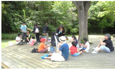
8月4日 三木山森林公園 へ

2学期がスタートし、子どもたちは久しぶりの学校へ。さて、どんな成長を見せてくれるのでしょうか。スタッフ一同、楽しみにしています。