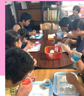
いろんな人に囲まれて。ゆっくり、のんびり