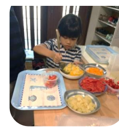
子どもたちは、太陽さんの給食が大好き。イリコも自家製。おやつフルーツポンチ