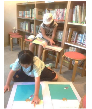
西部図書館へ 大型絵本を読んでいま