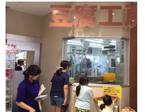
稲見町 にじいろふぁーみんへ