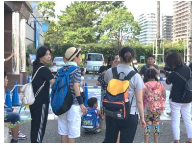
8月23日 須磨水族館へ