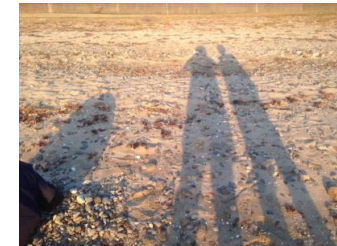
好天の浜で、「シーグラス」をさがしました。夕暮れが早く、影法師がぐーんと伸びます。