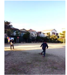
たこあげを楽しみました。