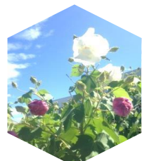
太陽の畑の 酔芙蓉