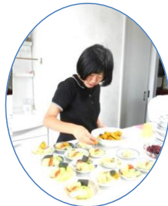
お手伝いも楽しみ