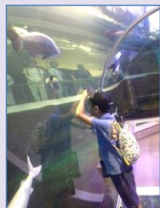
アマゾン館のトンネルがお気に入り

8月28日(金) 須磨の水族園に遠足に行きました。電車グループと車移動グループに分かれて、行動。 みんなで、お弁当を食べて、イルカのショーを見ました。