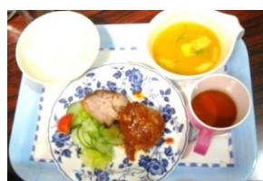
給食とおやつは、最大の楽しみの時間