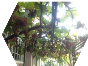
「太陽の子」のぶどう