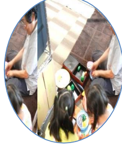
お友だちとままごと遊び