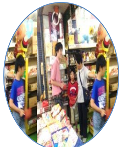
近所の駄菓子屋さんへ