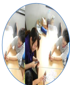
みんなでトランプ遊び