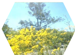
「水辺の里公園」の オミナエシ